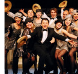
reżyseria: JANUSZ JÓZEFOWICZ ( Złoty Liść Retro '2004)